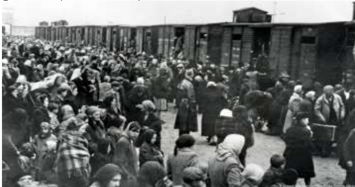
Deportarea evreilor spre ghetouri și lagărele de concentrare

La 18 octombrie 1941, pleca din gara Berlin primul transport de 1 089 de evrei, femei, copii și bărbați. Erau duși la ghetoul din Łódź. Până la sfârșitul războiului, din cele trei gări berlineze au fost deportați peste 50 000 de evrei și alte milioane din teritoriile cucerite. De la domiciliile lor, din ghetouri sau din lagăre de tranziție, deportații – bărbați, femeii, copii –, familii întregi, tineri, bătrâni, erau luați cu forța și, în coloană, sub amenințarea armelor soldaților germani sau ai celor din trupele SS (trupe de elită), erau duși la gară. Acolo erau înghesușiți în vagoane de transportat vitele. Călătoria dura mai multe zile, fără apă, fără hrană, fără minime condiții igienice. Unii mai în vârstă sau bolnavii nu rezistau până la destinație și mureau pe drum. Alții își dădeau seama ce îi așteaptă și încercau să sară din trenul în mers când se apropiau de destinație, găsindu-și astfel sfârșitul.