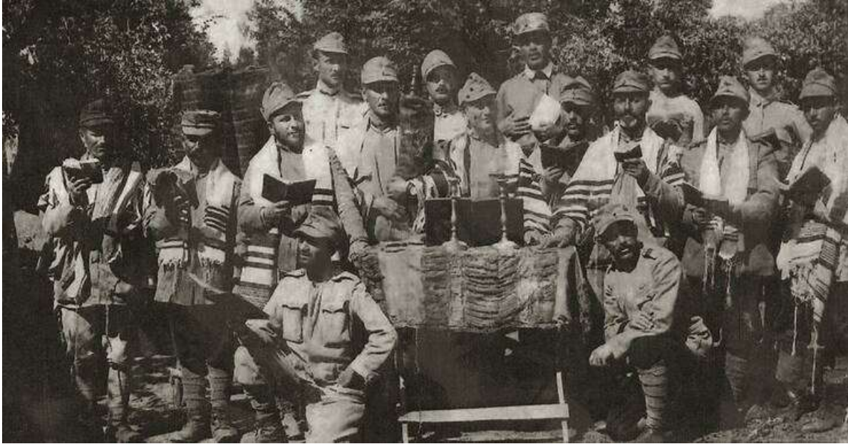
Militari evrei în armata română în Primul Război Mondial

Pe baza surselor, realizați în aproximativ o pagină, o investigație referitoare la participarea evreilor din localitatea în care locuiți, în armata română în Războiul de Independență (1877–1878), în Al Doilea Război Balcanic din 1913 și în Primul Război Mondial (1916–1918).