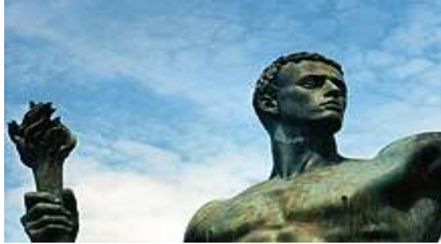
Die Partei , Sculptura realizată de către Arno Breker, simbolizând „Supraomul”