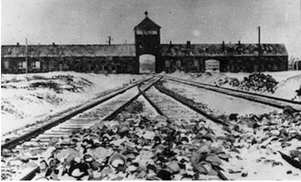
Intrarea în lagărul de la Auschwitz