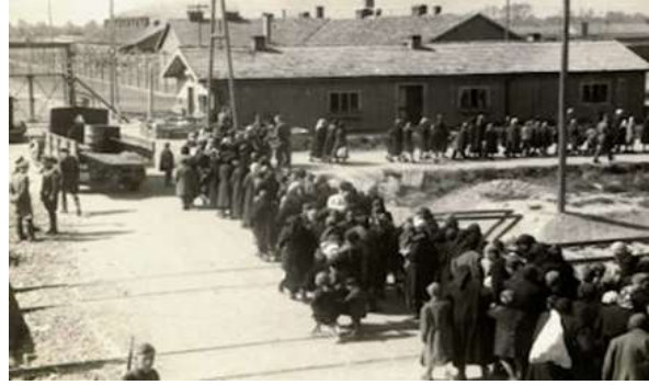
Sosirea unui nou transport de evrei în lagăr