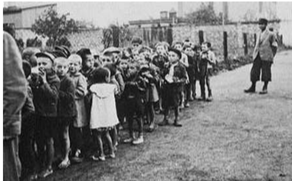
Copii în ghetoul din Łódź

După invadarea Poloniei, naziștii au început în orașele și târgurile locuite de polonezi, să stabilească zone în care au înghesuit evreii din împrejurimi și pe cei deportați. Numite ghetouri , acestea au devenit și ele instrumente de ucidere în masă a evreilor. Au existat trei categorii de ghetouri: deschise, închise și de distrugere. Cele deschise nu aveau garduri sau ziduri, spre deosebire de cele închise. Ghetourile de distrugere erau complet închise, aici fiind evreii care așteptau să fie duși spre lagărele de concentrare ori să fie scoși în afara orașului pentru a fi împușcați.