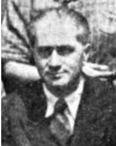
Filderman la ghetoul Moghilev din Transnistria în 1942

În 1931, având la bază organizații ale evreilor din Transilvania, Basarabia și Vechiul Regat, grupate în Clubul Parlamentar Evreiesc , s-a constituit Partidul Evreiesc din România care avea drept principii fundamentale: solidaritatea cu națiunea română, apărarea drepturilor civile și politice prevăzute de Constituție și asigurarea deplinei egalități civice pentru cetățenii de origine evreiască. Partidul Evreiesc din România s-a aliat în alegeri cu Partidul Național-Țărănesc . Partidul Evreiesc din România se diferenția de Uniunea Evreilor Români , printr-o politică înclinată spre sionism.